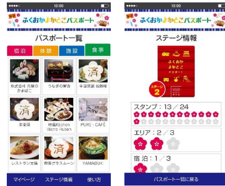
スマートフォン画面イメージ ※ 実際の画面と異なる場合があります